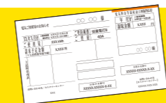
※イラストはイメージです。

※補助金には受給条件・予算枠があり、適用されないまたは、上限金額での支給がされない場合があります。