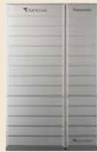
貯湯ユニット・熱源機一体型 エネファーム ※画像はイメージです。